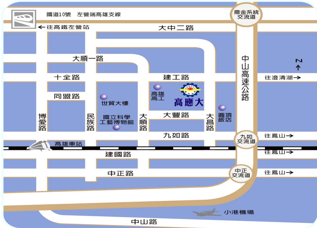
國立高雄應用科技大學位置圖